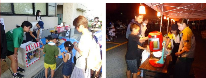
R5 子ども縁日 R5 ガラポン抽選会

8月3日(土)17:00~20:00 夏祭りを開催します。出店や子ども縁日が登場!! ステージ演奏もありますので、お楽しみに♡ 7月8日(月)から、ガラポン抽選付のお得な前売り1,000円チケットを販売します。(100枚限定)