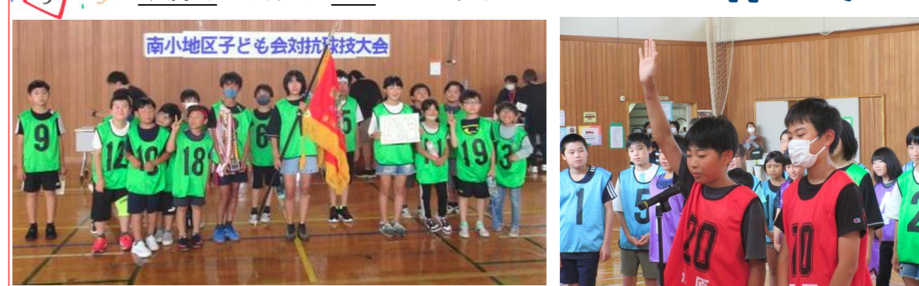
南小地区子ども会対抗球技大会

6月8日(土)には、ドッチボール大会が行われ6チームが参加し、選手・観客が見守る中、熱戦が繰り広げられました。 優勝 合同A(宮下町、中上野町、南大鐘)、 準優勝 川端A、 3位 西上野町