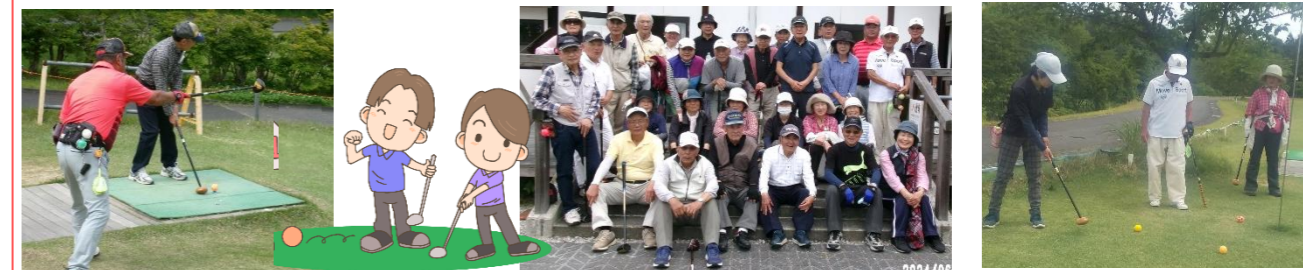
6月9日(日)南体育会主催の交流会が、ふれあいの丘公園パークゴルフ場で行われ、参加者34名で楽しみました。