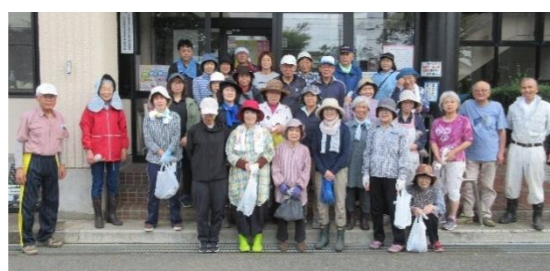
ありがとうございました。

6月16日(日)6:00~7:00 定期利用団体の月~水曜日の24団体44名のみなさんにセンター前庭の除草作業にご協力いただき、とてもきれいになりました。