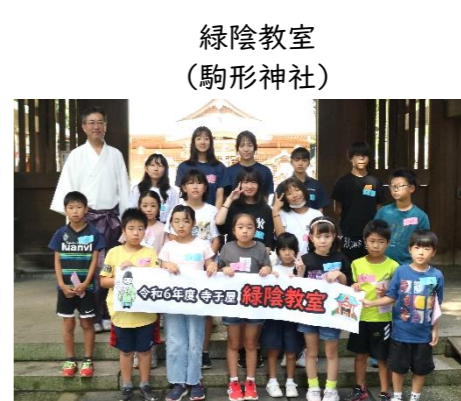
緑陰教室 (駒形神社)