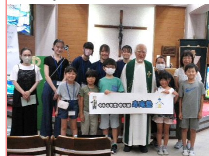
寿庵塾 (カトリック水沢教会)

今年は、熱中症対策を考慮し、1ヶ月遅らせて9月7日(土)・8日(日)に開催しました。寺子屋リーダー(中高生)と寺子(小学生)が貴重な時間を一緒に過ごしました。寺子は「また来年も絶対に来る」と笑顔で語ってくれました。